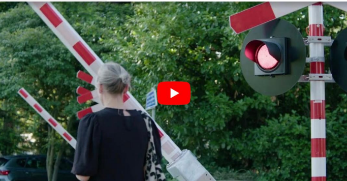
Onze videograaf Arne van der Heijden maakte bovenstaand videoverslag.

Voor omwonenden, ziekenhuisbezoekers, trambestuurders en automobilisten is dit vooral een opluchting. De Koekoekslaan is eindelijk een stuk veiliger gemaakt.