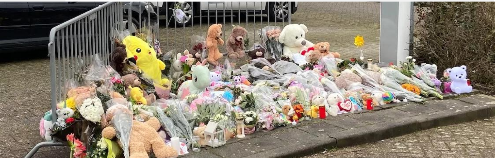
De herdenkingsplek met bloemen in de Anemoonstraat