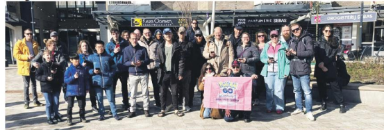
Pokémon GO Tour Unova, waar we allemaal erg enthousiast waren om black kyuren en white kyuren te krijgen. Foto is genomen op Muurplein, het startpunt.

Op een doordeweekse avond bij winkelcentrum Makado of een zaterdagmiddag in park de Kokkebogard zie je ze ineens: een groep mensen, jong en oud, allemaal met hun telefoon in de hand. Ze blijven even staan, lachen, wijzen iets aan op hun scherm en lopen dan verder.