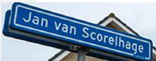
Alle straten, lanen, driften, pleinen en wat dies meer zij, vastgelegd volgens een vast stramien: ter hoogte van het pand met huisnummer 1, midden op de weg, fietspad of trottoir de straat in gefotografeerd. Deze week de Jan van Scorelhage in Galecop.