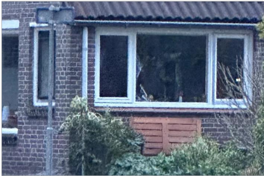
De vernielde ruit aan de Tristanlaan

Met de opening van KADOOTJE is de buurt een frisse en laagdrempelige ontmoetingsplek rijker. Bezoekers zijn welkom om iets bijzonders te kopen, inspiratie op te doen of gewoon even binnen te lopen aan Het Sluisje 25.