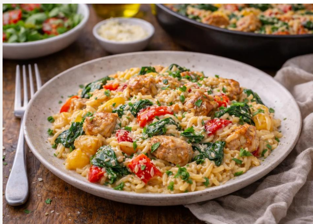
Romige orzo met kip, paprika en spinazie. In één pan