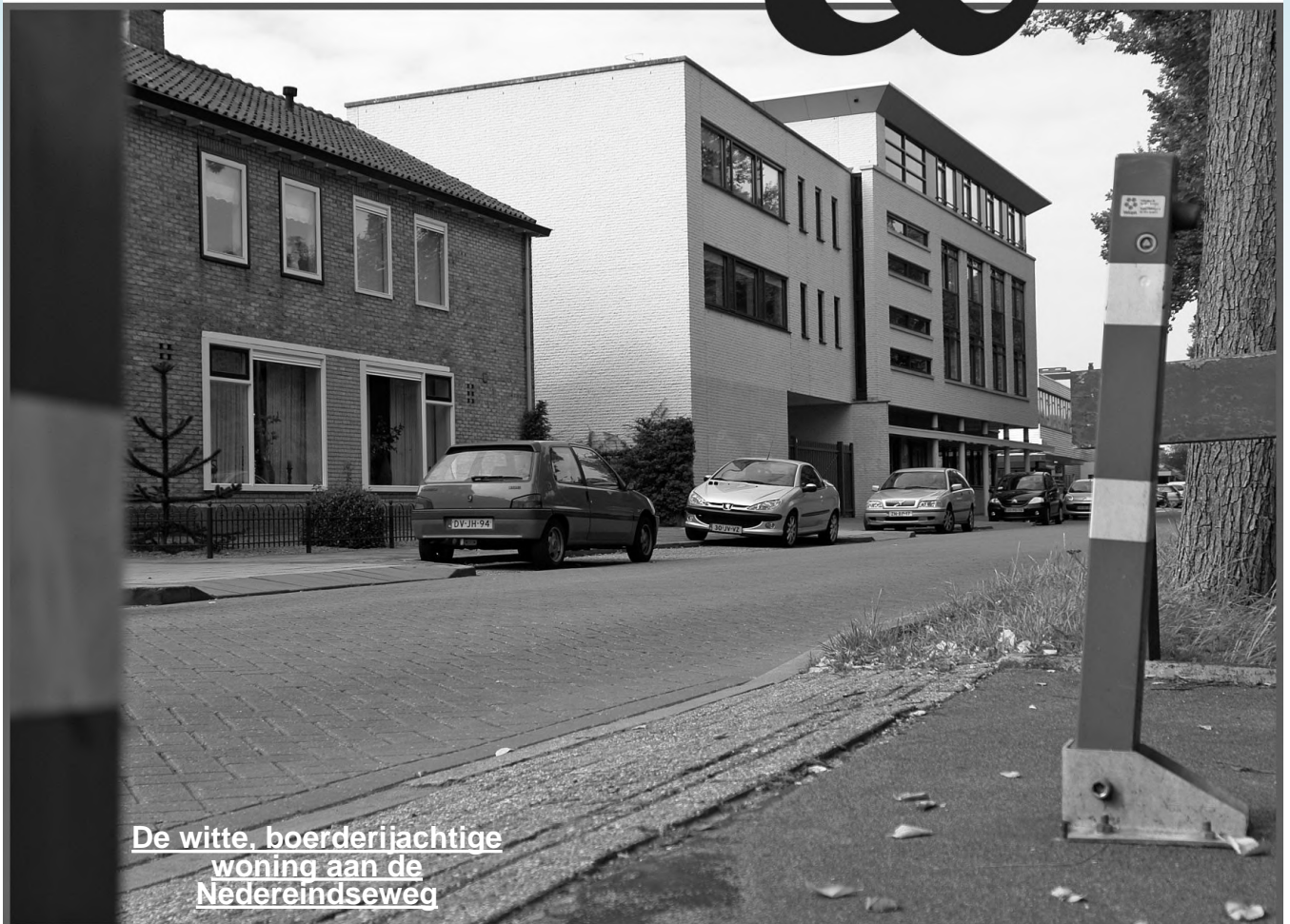
De witte, boerderijachtige woning aan de Nedereindseweg