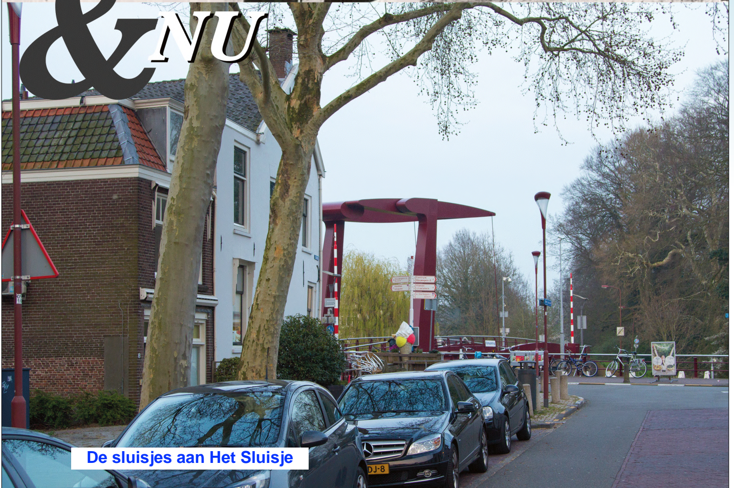
De sluisjes aan Het Sluisje