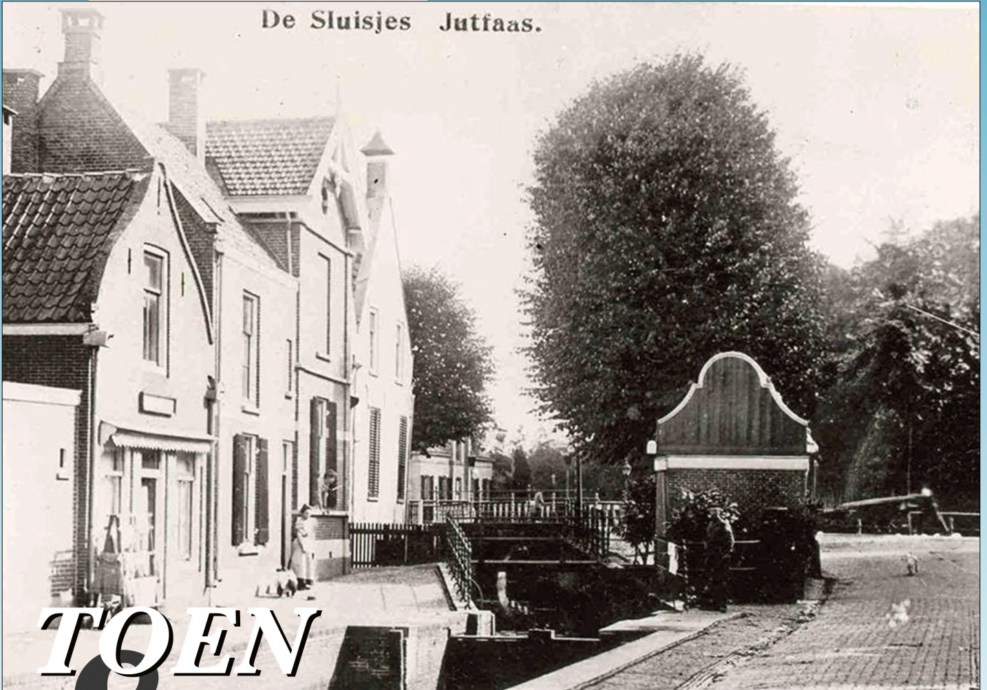
De Sluisjes Jutfaas.