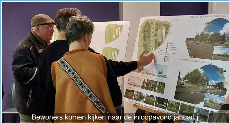
Bewoners komen kijken naar de Inloopavond januari jl.