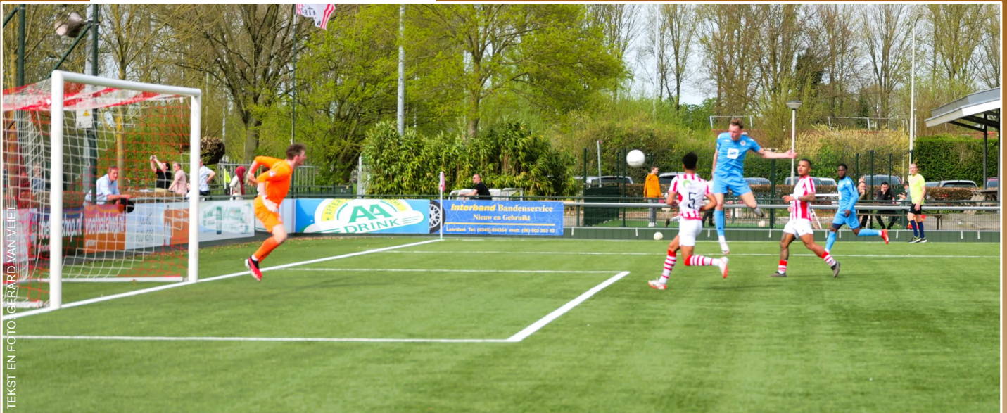
TEKST EN FOTO: GERARD VAN VLIET