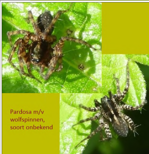
Pardosa m/v wolfspinnen, soort onbekend