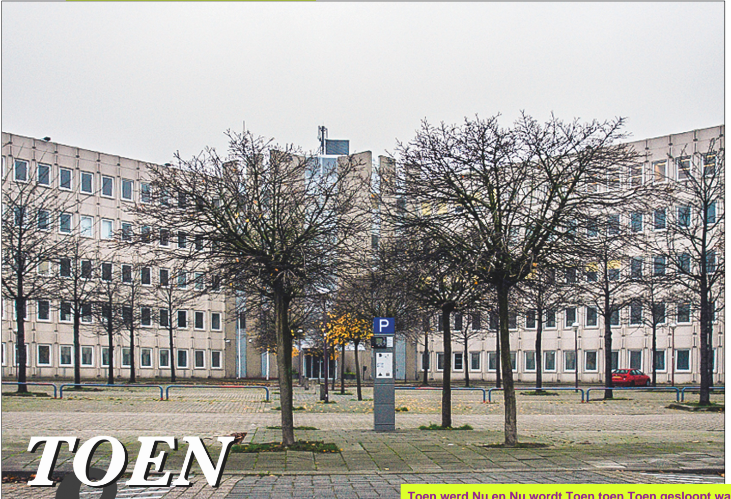
Toen werd Nu en Nu wordt Toen toen Toen gesloopt was