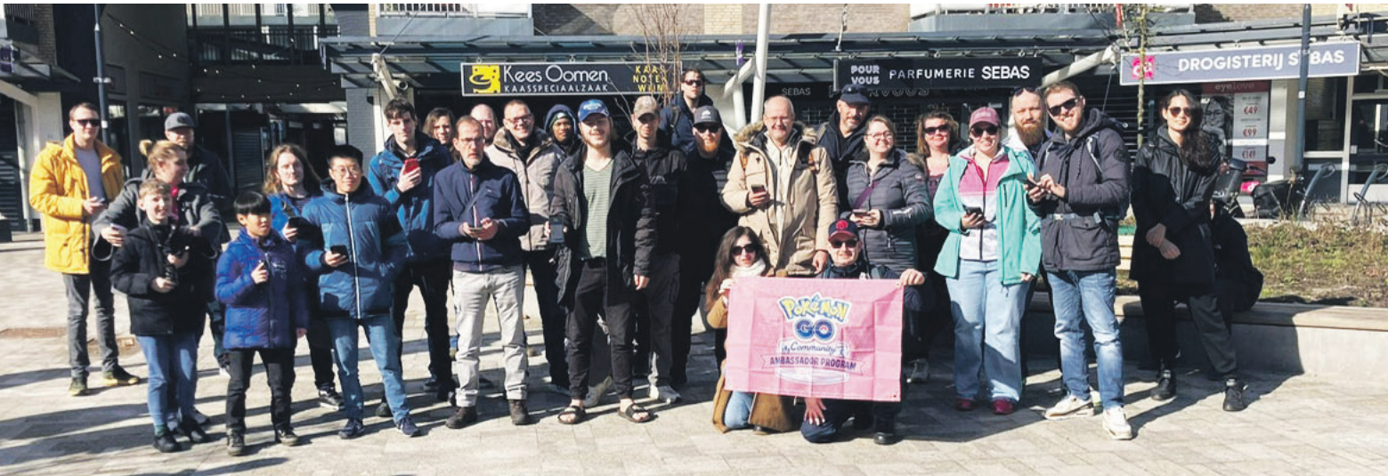
Pokémon Go Tour Unova, waar we allemaal erg enthousiast waren om black kyurem en white kyurem te krijgen. Foto is genomen op Muntplein, het startpunt.

Op een doordeweekse avond bij winkelcentrum Makado of een zaterdagmiddag in park De Kokkebogaard zie je ze ineens: een groep mensen, jong en oud, allemaal met hun telefoon in de hand. Ze blijven even staan, lachen, wijzen iets aan op hun scherm en lopen dan verder.