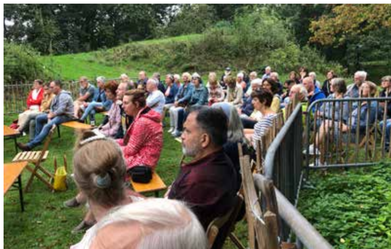
Een zomer vol muziek op Fort Jutphaas. Het aandachtige publiek bij de Indigo BigBand.

De mooiste dingen in het leven zijn gratis. Zo ook Bij de Fortwachter. Het hoort eigenlijk niet bij onze wijken, maar het is lekker dichtbij. Even de Rijnhuizerbrug over en je bent bij Fort Jutphaas. Dat is al sinds 1820 een fort van de Nieuwe Nederlandse Waterlinie, het oudste zelfs. Maar als fort is het al lang niet meer in gebruik. Wel als plaats om te ontspannen, met een mooi, luxe restaurant Céline en sinds een paar jaar ook Bij de Fortwachter. Dat laatste is een groen koffiehuis, B&B en buitenplaats op het mooiste groene, verborgen plekje van Nieuwegein, een pareltje.