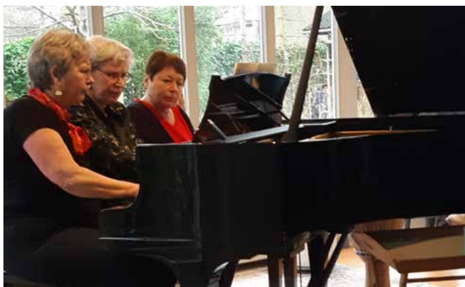
De dames van Pia3.