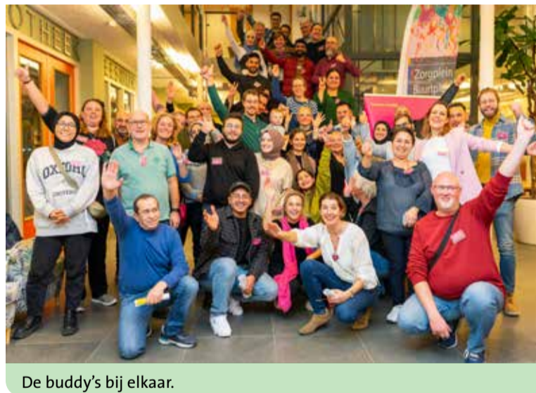
De buddy's bij elkaar.

Op woensdagavond 7 februari startte de eerste ronde van Buddy to Buddy Nieuwegein. 46 Buddy's, inwoners en nieuwkomers, ontmoetten elkaar tijdens het matchingsdiner voor het eerst. Op deze avond legden ze op een grappige en interactieve manier contact met elkaar. Het was een heel geslaagde avond met 23 enthousiaste koppels. De buddy's ontmoeten elkaar