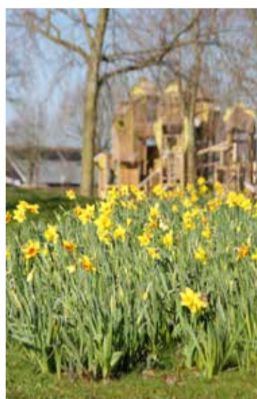
Voorjaar in Park Blokhoeve.