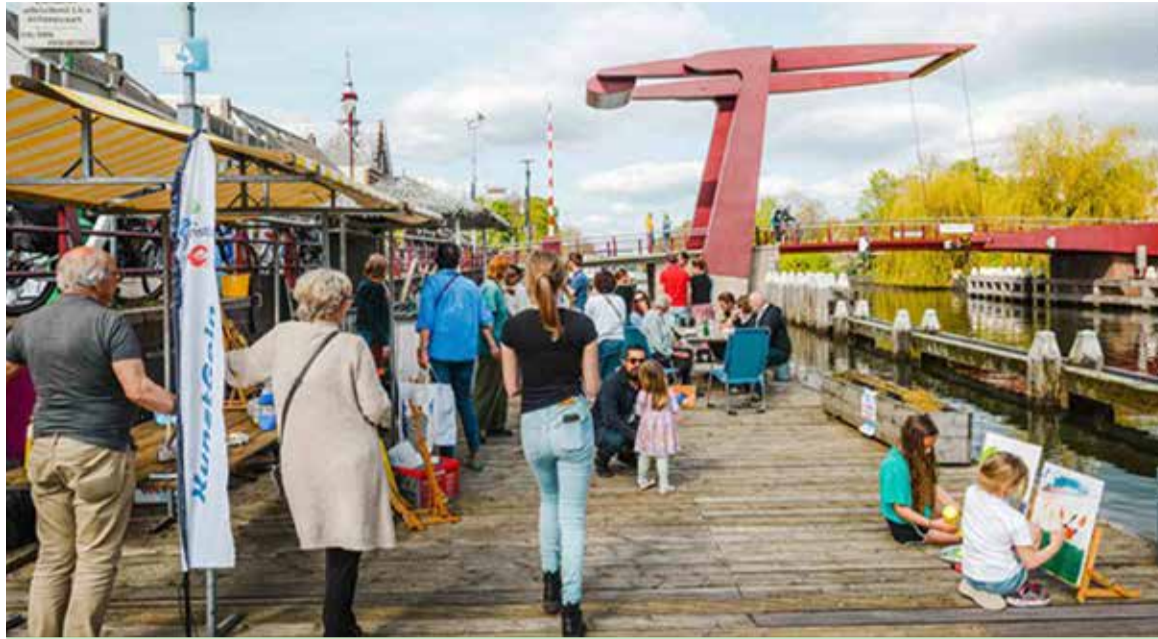
Er is van alles te beleven en te doen tijdens de Dag van de Vaart op 14 april.