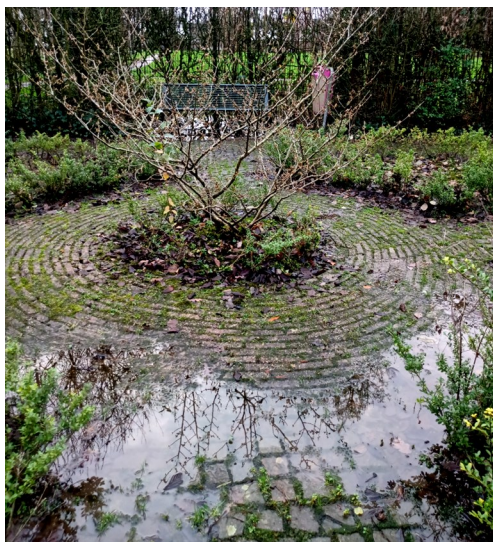
Zelfs een natte kruidentuin heeft zijn charmes.