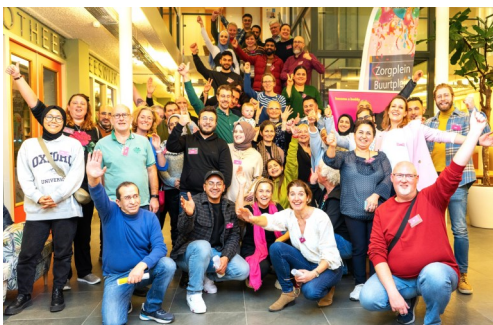
De eerste ontmoeting van de nieuwe buddy's bij het matchingsdiner op Buurtplein Zuid.

Tijdens het zeer geslaagde matchingsdiner hebben 46 buddy's, inwoners en nieuwkomers, elkaar voor het eerst ontmoet en op een grappige en interactieve manier contact met elkaar gelegd. Hierna zullen de 23 koppels elkaar gedurende vier maanden wekelijks ontmoeten en nog zes keer als groep samenkomen. In juni wordt deze eerste ronde afgesloten met een feest.