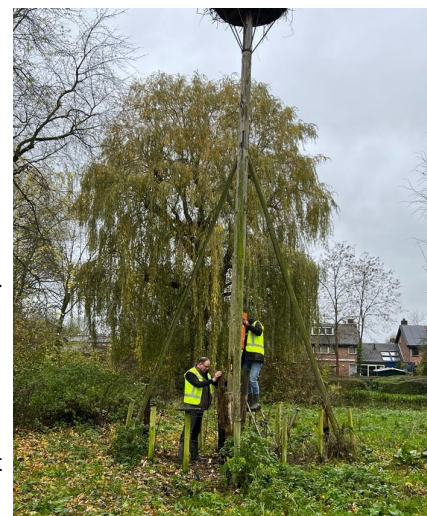
Vrijwilligers van het wijknetwerk bevestigen nieuwe palen tegen de oude nestpaal en de steunpalen aan.

Door: Kees Koot | vice-voorzitter Wijknetwerk Batau-Noord