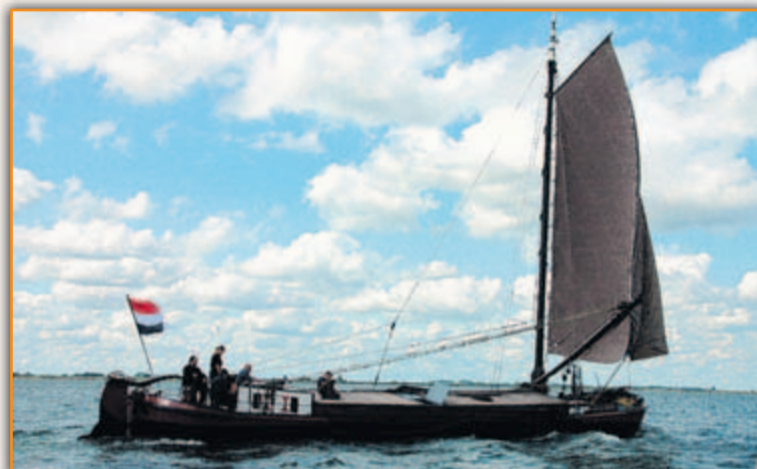
Aaltje wordt in de vaart gehouden door de vereniging het Zeilend Bolschip.

haar ligplaats in de Museumhaven en zij gaf regelmatig acte de présence tijdens Vreeswijk bij Kaarslicht en niet te vergeten als intocht-schip van Sinterklaas. Meer informatie over de vereniging vind u op www.bolschi-paaltje.nl .