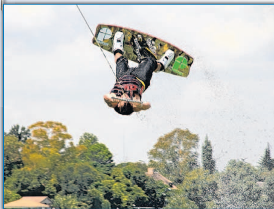
Volop actie tijdens de demo's wakeboarding.

Het is weer bijna zover. Koninginnedag 2012 staat weer bijna voor de deur. Het seizoen voor de wakeboarders is weer van start gegaan, het is nog koud maar dat houdt deze jongens niet van het water.