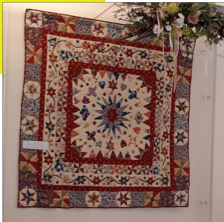
Foto boven: Helemaal op de hand gemaakt. Door Bep van Vliet. Toen was zij 89 jaar oud Foto onder: Top van een Quilt gemaakt op naaimachine