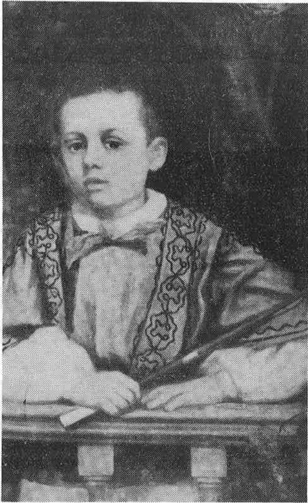
Afbeelding van het geschilderde portret van Francois Heytink-Baesjou, dat in De Lantaern hangt.