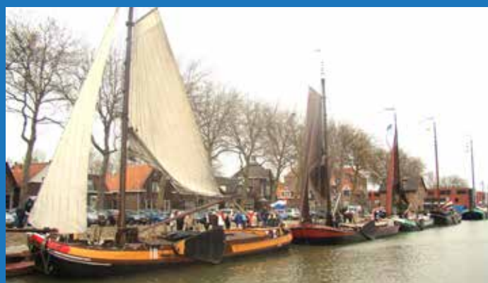
2008 opening Museumhaven