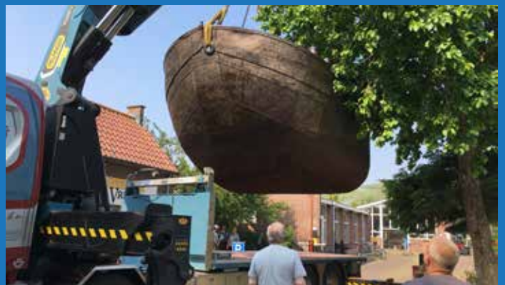
2021 plaatsing boegbeeld