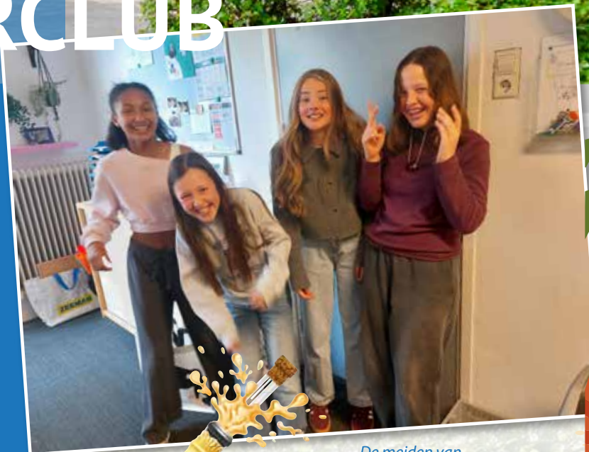
De meiden van de redactie hebben lol.