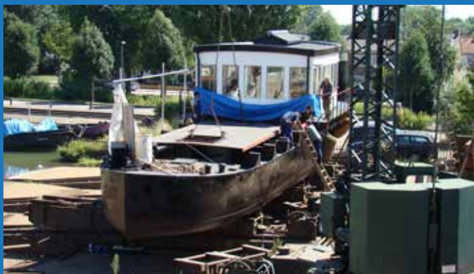
2016 nieuw dek