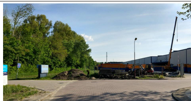
Afbeelding 3: Situatie van 29 april 2019, genoemde ecologische verbindingzone is vernietigd en wandelpad verdwenen!