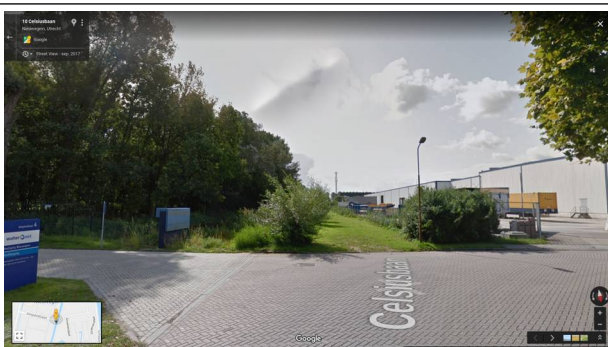
Afbeelding 2: Situatie van september 2017 (uit Google maps), ecologische verbindingzone en wandelpad intact.